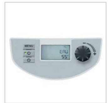
Panneau de commande