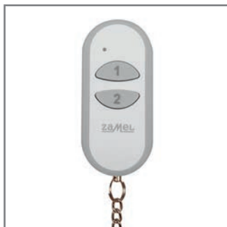
• Contrôle individuel sans fil.