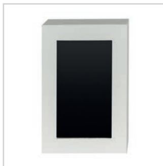
• Détecteur de mouvement.